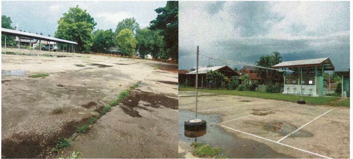
ลานกีฬา ม. 6 ตำบลหนองขาม อำเภอคอนสวรรค์ จังหวัดชัยภูมิ