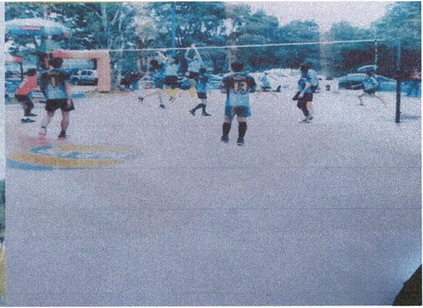
สนามกีฬา หมู่ที่ 4,9 ตำบลหนองขาม อำเภอกอนสวรรค์ จังหวัดชัยภูมิ