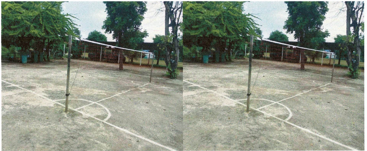
ลานกีฬา ม. 11 ตำบลหนองขาม อำเภอคอนสวรรค์ จังหวัดชัยภูมิ