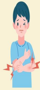
ปวดเมื่อยตามร่างกาย